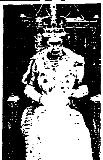
الملكة إليزابيث تلقى خطاب العرش أمس

أعلنت الملكة إليزابيث في خطاب العرش الذي ألقته أمام البرلمان البريطاني أمس، أنه سيتم فرض ضريبة خاصة على شركات الطيران (حوالي 10 ملايين جنيه سنويا) كل راكب يستقل طائرة في جميع مطارات المملكة المتحدة.